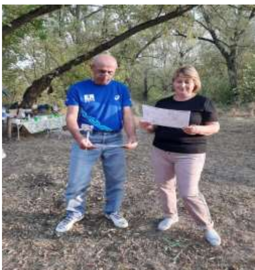
Интересный туристический маршрут

Профсоюзная организация участвует в создании условий для оздоровления работников, пропагандирует вопросы популяризации здорового образа жизни среди членов коллектива. В текущем году была организована пешая прогулка по правому берегу реки Дон. Преподаватели специальности «Туризм» разработали интересный туристический маршрут, который предполагал прохождение квеста, спортивные испытания, награждение. Интересная и содержательная программа позволила повысить настроение, снизить усталость и оздоровить эмоциональный фон участников.